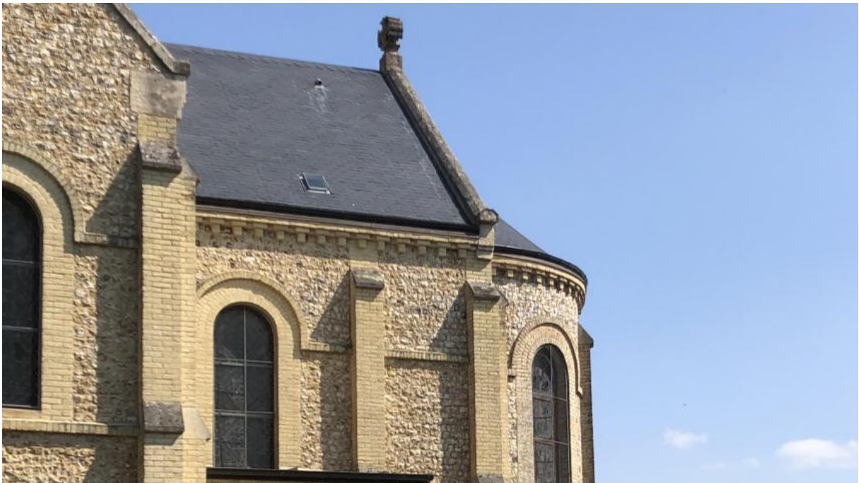
L'église de Rocquefort, en fin de parcours de la randonnée. - Louise Julien