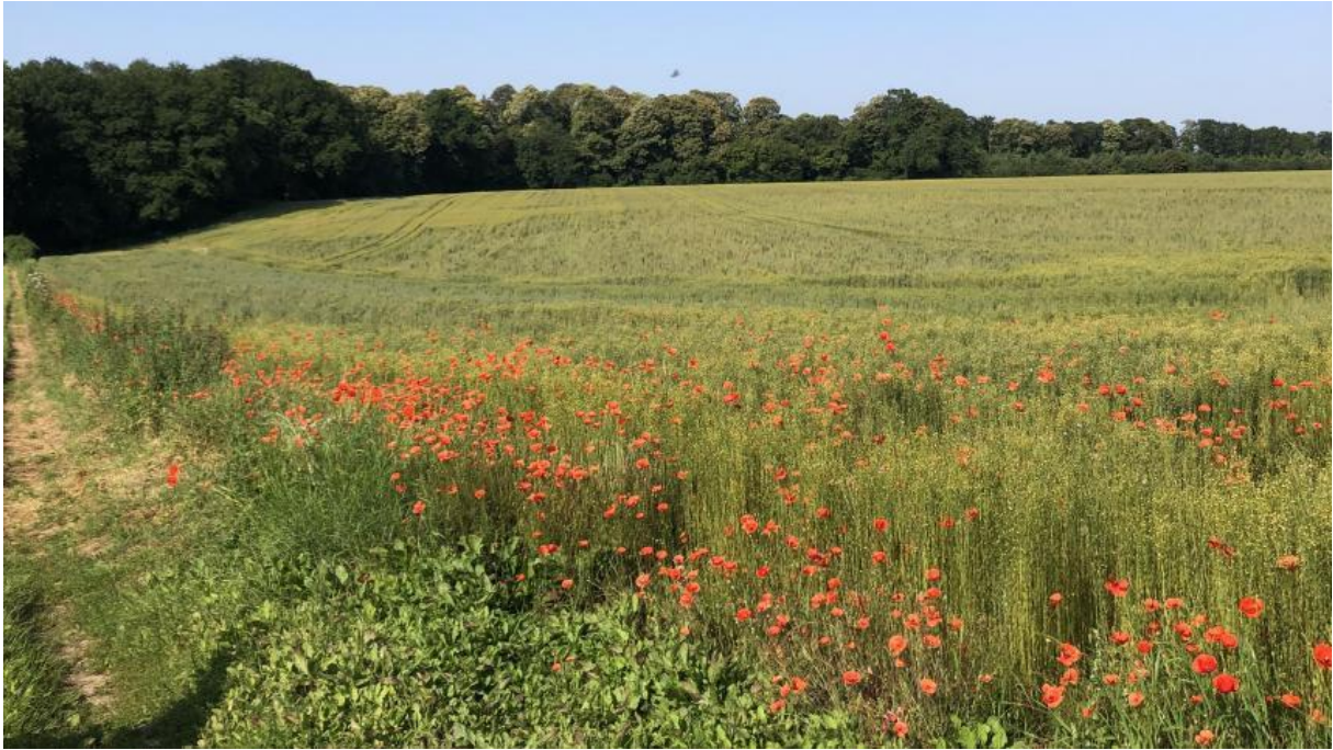
Un chemin bucolique, en bord de champ. - Louise Julien